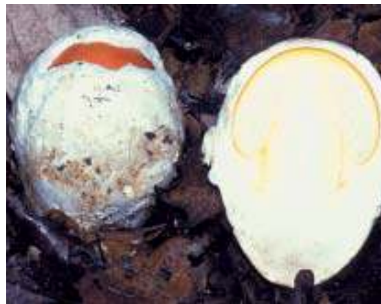
Ovuli di A. caesarea

rio è quello di distinguere tali funghi allo stato di ovuli.