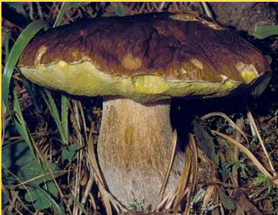
Boletus edulis Bull. : Fr.

GRUPPO MICOLOGICO AVIS ADERENTE ALL'ASSOCIAZIONE MICOLOGICA BRESADOLA