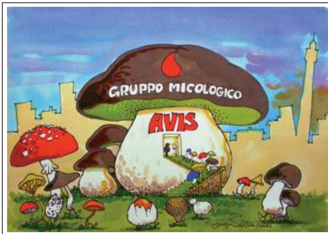
Disegno di Giorgio Serra