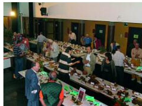
Mostra di Bologna

scana, che ha visto parecchi partecipanti e molti funghi, è stato molto apprezzato. Anche il Pranzo Sociale ha avuto un buon successo di partecipanti e di qualità gastronomica: ottima anche l'idea di noleggiare un pullman per chi non può o gradisce poco viaggiare in macchina. L'apoteosi sono stati gli auguri che ci siamo fatti l'ultimo lunedì utile di dicembre. Fra un po' inizia il nuovo anno micologico e spero che ci troveremo in tanti all'Assemblea Ordinaria del 29 gennaio 2007.